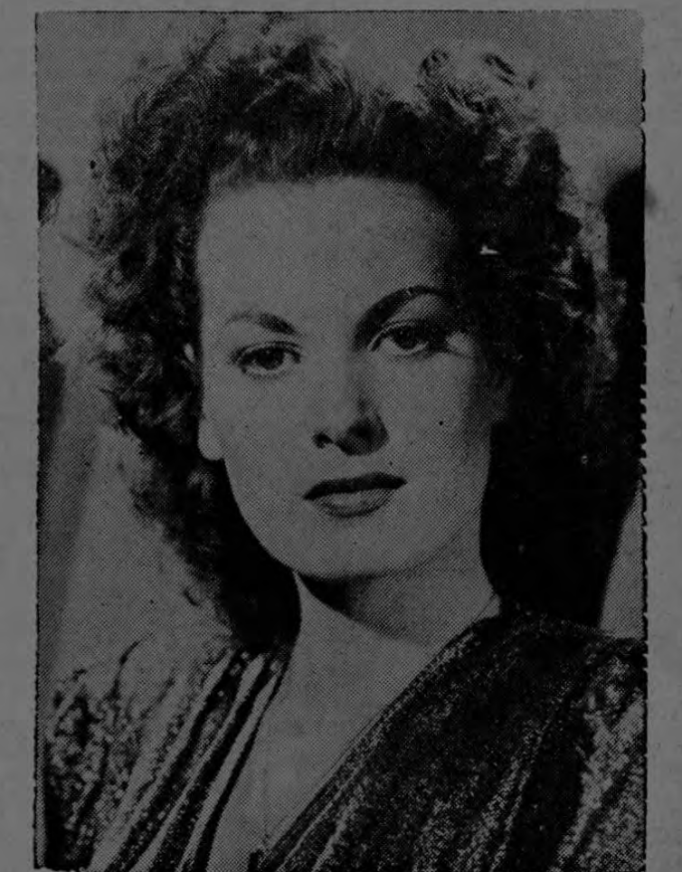
MAUREN O'HARA, lindísima estrella de RKO, cuya voz es tan glamorosa como su apariencia, según opinión del condecorado experto en belleza de Hollywood Max Factor Jr.

En la mayoría de las conversaciones las personas que toman parte disponen del tiempo suficiente para hablar pausadamente; no obstante, algunas se apresuran, como si se tratara de un asunto de vida o muerte. Muy de raras se presenta el caso de que haya algo tan importante que deba decirse apresuradamente.