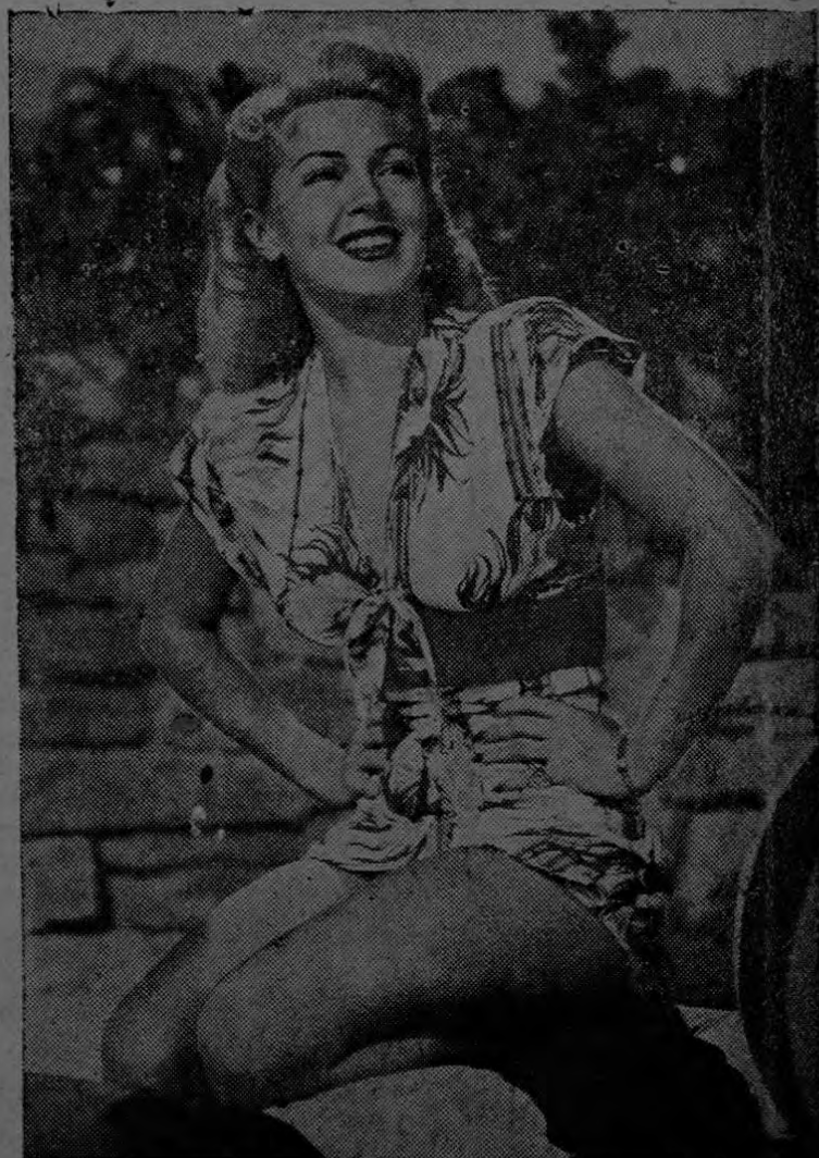
Bellísimo modelo de traje de baño en tela estampada en vivos tonalidades, que da especial realce a la figura femenina; la parte superior tiene mangas cortas y está anudado al frente; el pantaloncito es aparte, dejando ver una parte del abdomen. Este estilo es la última novedad en modas para playa.